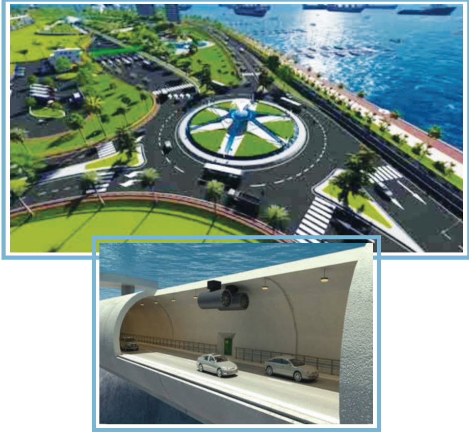
কর্ণফুলী টানেল, চট্টগ্রাম

কর্ণফুলী টানেল কর্ণফুলী নদীর তলদেশ দিয়ে ৪ লেন বিশিষ্ট সড়ক টানেল। টানেলটি কর্ণফুলী নদীর দুই তীরের অঞ্চলকে সুড়ঙ্গ পথে যুক্ত করবে। এই টানেলে ঢাকা-চট্টগ্রাম-কক্সবাজার মহাসড়ক যুক্ত হবে। টানেলের দৈর্ঘ্য ৩.৪৩ কিলোমিটার। এটিই বাংলাদেশের প্রথম সুড়ঙ্গ পথ। যোগাযোগ ব্যবস্থার সহজীকরণ, আধুনিকায়ন, শিল্প কারখানার বিকাশ সাধন এবং পর্যটন শিল্পের উন্নয়নের ফলে কর্ণফুলী টানেল বেকারত্ব দূরীকরণসহ দেশের অর্থনৈতিক উন্নয়নে ব্যাপক ভূমিকা রাখবে।